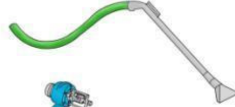
Hidrolik tahrikli pompa